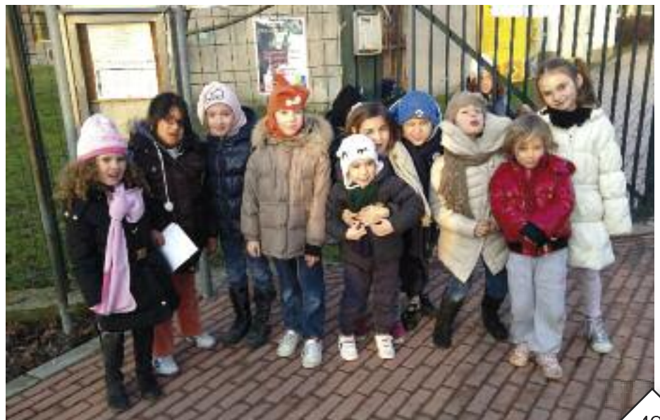
Il gruppo dei bambini creativi

creare una ludoteca dove vivere con i rispettivi bimbi momenti di svago ma anche di laboratorio, utili a fortificare la rete con le altre realtà già presenti quali il comitato Vivere Noverasco . Nei pomeriggi di martedì e giovedì, dopo l'orario scolastico, i piccoli della scuola materna e i più grandicelli delle elementari, accompagnati dalle rispettive mamme, si incontrano nello spazio messo a disposizione dal Comune e, dopo aver riequilibrato con il gioco le lunghe ore passate a scuola, si cimentano nella preparazione di manufatti sul tema che viene loro proposto. A Natale il loro presepe, molto apprezzato, è stato esposto nell'atrio