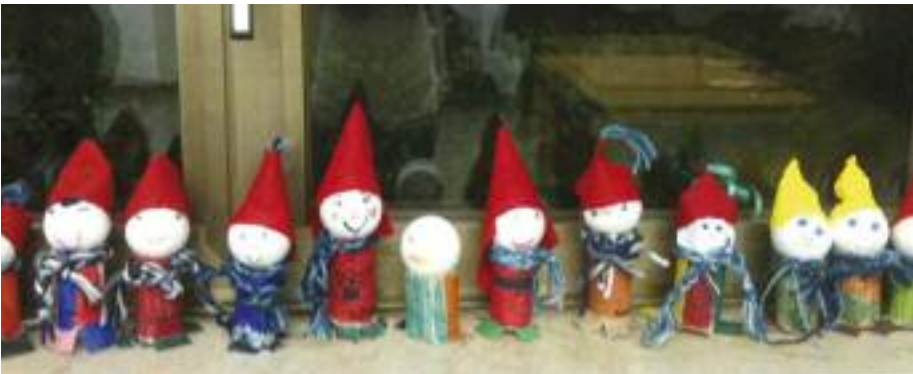
I simpatici folletti di Natale creati dal laboratorio

Tutte le attività del Comitato Vivere Noverasco vengono svolte grazie alla disponibilità dei volontari.