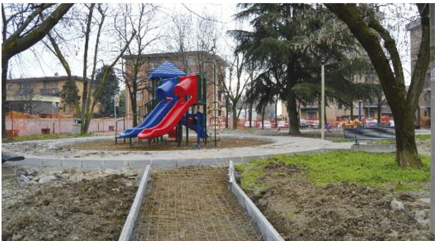
Lavori quasi ultimati in Via Carducci e Mazzini