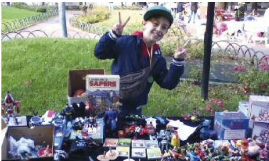
... i pionieri di questa bella avventura

citofono dedicato all'iniziativa). Informazioni si possono reperire anche al seguente numero di telefono: 3896778165 oppure su facebook cercando l'Angolo del mercatino dei bambini, dove si potrà trovare anche la modulistica. Le iscrizioni potranno essere consegnate anche il giorno stesso dell'evento. Naturalmente, in questo caso, sarà necessario verificare la disponibilità degli spazi eventualmente rimasti in seguito alle assegnazioni già effettuate a favore dei bambini che si saranno iscritti entro sabato 16 marzo. Anche i tavoli disponibili per le esposizioni saranno forniti in base all'ordine cronologico di arrivo delle adesioni. Quindi, non perdere tempo e iscriviti!