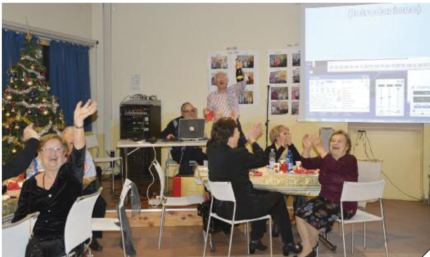
Un effervescente momento della festa di Capodanno

Una fucina di idee è già nata al Giardino delle età, dove tempo libero e cultura convivono sotto l'occhio esperto di professionisti del mestiere che nulla lasciano al caso e puntano alla costruzione di corresponsabilità, in continuo dialogo con il Comune che vive con soddisfazione questo centro vivace e carico di energia!