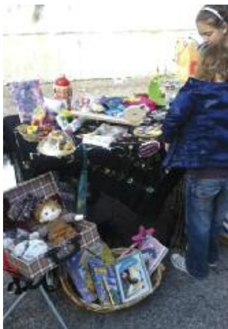
Il primo mercatino dei bambini del 21 ottobre...

domenica 17 marzo in via Dante, davanti al Comune