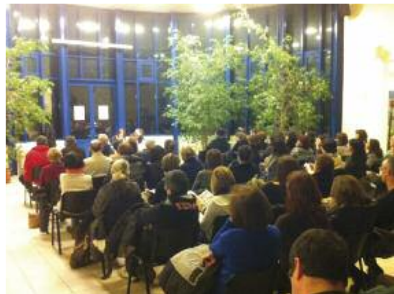
La sala Serafin al completo la sera del 24 gennaio