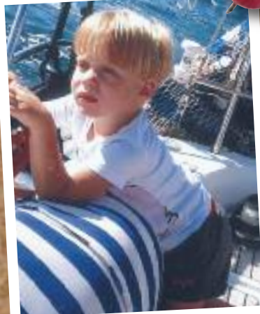
27 Marzo 2013 Auguri per i tuoi 4 anni dai tuoi 5 nonni