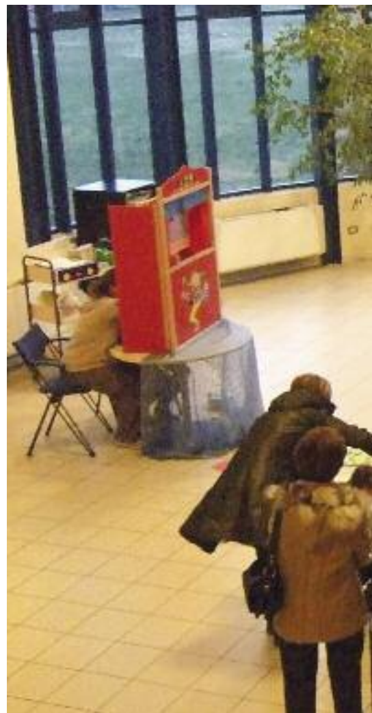
Un momento di "Raccontami una storia di Natale"