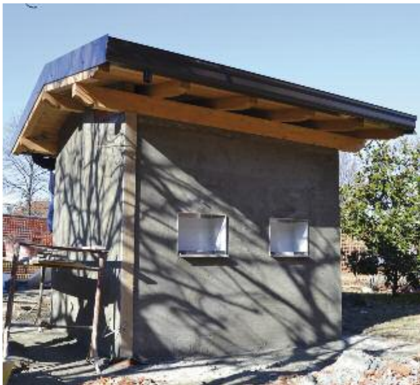
La struttura quasi ultimata

Procedono i lavori alla nuova casa dell'acqua di Via Gramsci angolo Piazza Falcone dove sorge la struttura che servirà il lato ovest della Città. Mancano gli allacciamenti e le finiture per cui le rigide temperature hanno reso impossibili alcuni interventi ma, entro la primavera, dovrebbe essere garantita l'erogazione gratuita di acqua naturale e frizzante.