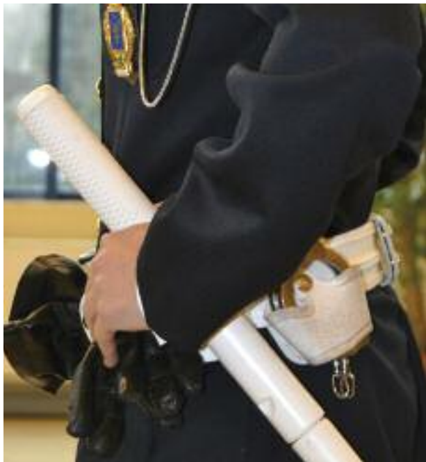
Il bastone estensibile nella nuova dotazione