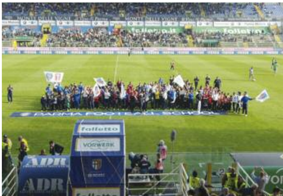
Tutti allo stadio di Parma

ciale FIGC della Delegazione Lombarda è stato raggiunto l'obiettivo di essere annoverata Scuola Calcio riconosciuta e quindi è un motivo soddisfazione e di apprezzamento del lavoro che il nostro staff tecnico ha raggiunto. Ora il compito diventa ancora più difficile perché rimanere a questo livello comporta ulteriori sacrifici e soprattutto impegni però l'importante è sempre mantenere i piedi per terra senza creare false aspettative ma continuando sulla strada intrapresa fino adesso e dimostrando in qualsiasi momento un attaccamento per questa città, per questi colori e per questa missione. Ringraziamo gli sforzi dei genitori per garantire sempre ai nostri bambini la possibilità di essere sempre presenti alle sedute di allenamento e alle gare infatti il dato confortante è il 95% di affluenza nelle varie attività in tutte le fasce di età ne è una dimostrazione plausibile. Non ultimo per esprimere gratitudine è l'impegno profuso dall'Amministrazione Comunale sotto il punto di vista economico che per questa stagione sportiva ha fornito la possibilità di iscrivere tutte le nostre squadre ai campionati e ciò vuol dire un apprezz-