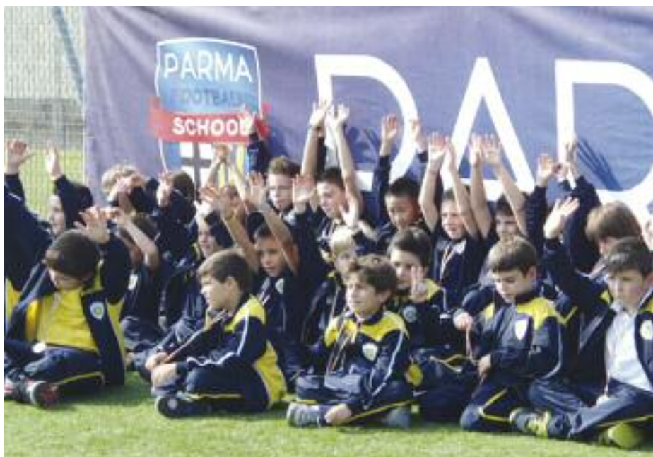
I pulcini del calcio Città di Opera

glio a livello regionale per raggiungere, l'under 21 la promozione e la juniores la salvezza.