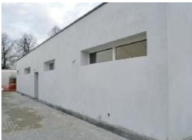
Lo stato dei lavori allo spogliatoio

Rallentati a causa del freddo, i lavori per lo spogliatoio della tensostruttura di Via Emilia, sono praticamente giunti alle ultime finiture. La consegna agli utenti della struttura sportiva è prevista entro questa primavera.