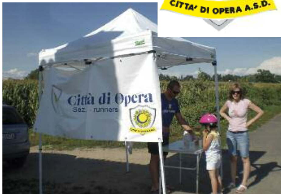
Il gazebo dei runners, un punto di ristoro per i corridori