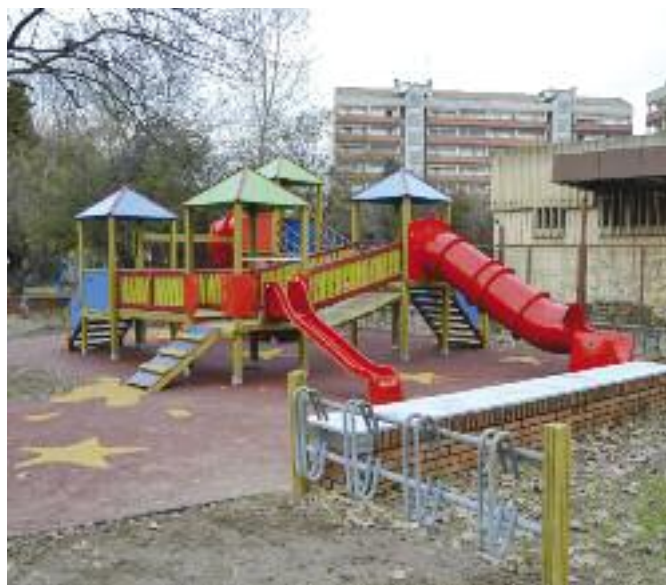
Il nuovo castello vicino alla posta

Con un primo intervento nella parte dedicata ai più piccini è stato posizionato un nuovo castello per i bambini, molto bello e funzionale, su una pavimentazione anti-trauma accattivante e sicura per gli utenti. Nuove sedute sui vecchi muretti, trasformati in panchine, e arredo urbano per rendere sempre più piacevole il tempo libero dei fanciulli. Anche i giochi a molla sono stati sistemati e la rastrelliera per le biciclette posizionata in luogo più idoneo per lasciare spazio alla sosta dei veicoli. In futuro il parco sarà progressivamente interessato da una totale ristrutturazione.