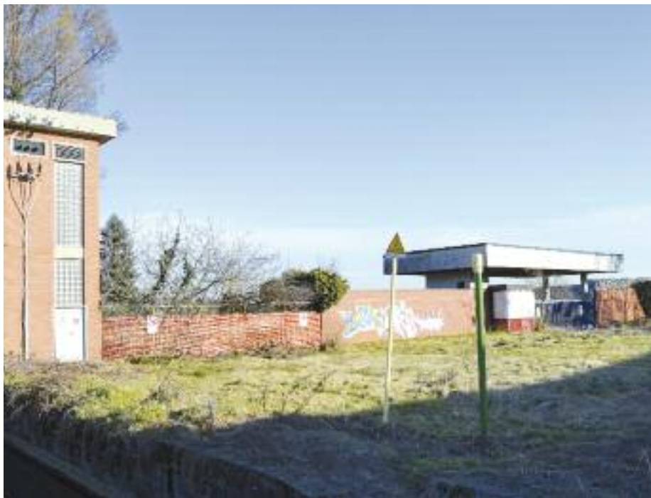
Area ex Saiwa

Proseguono le conferenze dei servizi con gli enti interessati, ma la posizione di Opera resta scettica