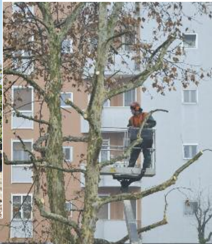
Giardinieri alle prese con un platano

Come di consueto il mese di febbraio è uno dei periodi in cui si eseguono le potature degli alberi per farli crescere rigogliosi ed in sicurezza ma anche per consentire ai lampioni di illuminare il più possibile le strade ed i parchi. Si approfitta di questi lavori per nuove piantumazioni, per l'eliminazione di radici che dissestano strade e marciapiedi e per lo spostamento di piante che impediscano agli utenti delle strade la corretta visione delle stesse, della segnaletica e dei pedoni.