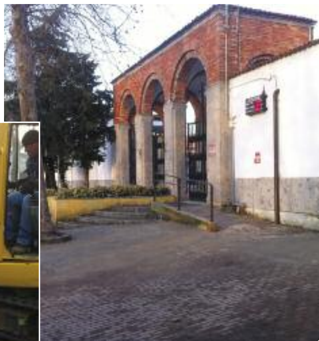
Lavori in corso al cimitero